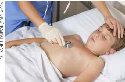
Belgien: Tod auf Bestellung

Mehr Info: www.imabe.org/index.php?id=2336