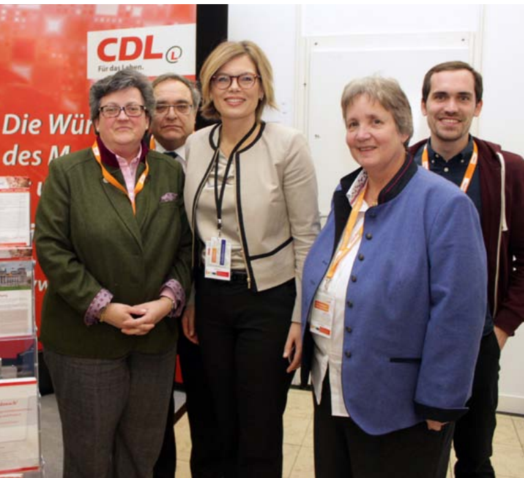
Julia Klöckner beim Stand der CDL auf dem CDU-Parteitag

Die CDL fragt deshalb anlässlich der aktuellen Debatte: Was ist in den vergangenen vier Jahren zur Verbesserung des Lebens-