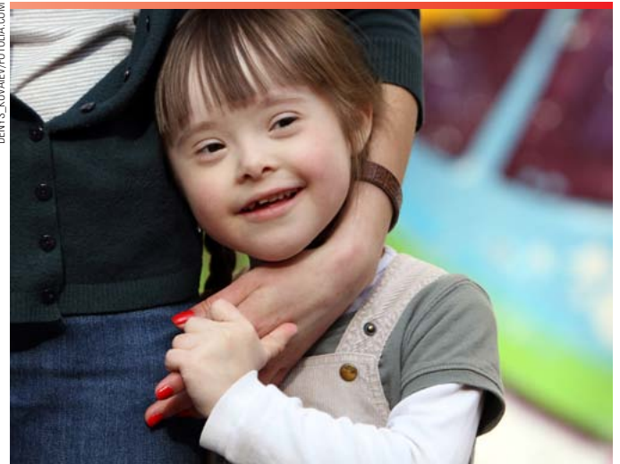
Mädchen mit Down-Syndrom

Mehr Info: www.idea.de/menschenrechte/detail/fuer-vier-von-zehn-deutschen-ist-abtreibung-toetung-98182.html