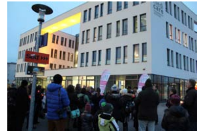
Demo vor der Stapf-Klinik

Als schließlich verkündet wurde, daß ab nächster Woche die Gehsteigberatungen vor dem Abtreibungszentrum wieder aufgenommen werden, um Frauen Hilfe anzubieten, gab es lang anhaltenden Applaus.