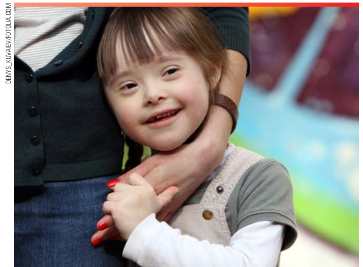
Mädchen mit Down-Syndrom

Mehr Info: www.idea.de/menschenrechte/detail/fuer-vier-von-zehn-deutschen-ist-abtreibung-toetung-98182.html