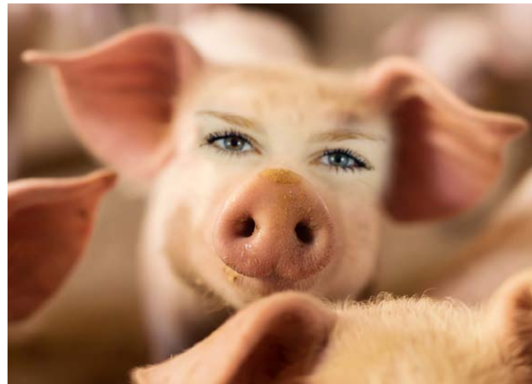
Beunruhigend: Mischwesen als Gewebespende (Bildmontage)

Bereits im Oktober 2011 fragte der Deutschen Ethikrat, „ob schon die Konstruktion eines menschlichen Mischwesens ... [nicht] eine vollständige Instrumentalisierung“ des Menschen