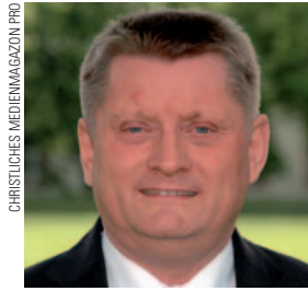
Herrmann Gröhe, CDU

Hinweis: Die DGPPN-Stellungnahme ist im Web zu finden unter www.dgppn.de/presse/pressemitteilungen/detailansicht/article/forschung-in.html