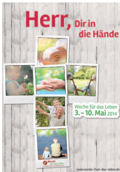
Plakat zur Woche für das Leben 2014

Aber warum, so fragte ich mich plötzlich, warum schreie ich nicht zum Himmel? Warum gebe ich mich schon geschlagen, obwohl ich eins der wirksamsten Mittel noch nicht einmal ausprobiert habe?